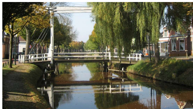
Eén van de bruggen over het Pekelder Hoofddeep

Inwoners stonden op hun achterste benen en de fanatiekste actievoerders richten "Bruggen Belang Pekela" (BBP) op. Zij hebben niks tegen bootjes door het Pekelderdiep, maar wel als dat ten koste gaat van de leefbaarheid van de Pekelders. Want mocht Pekela bijvoorbeeld kiezen voor de goedkopere dammen of vaste bruggen in plaats van beweegbare bruggen, dan kunnen de inwoners op veel meer plekken het water oversteken.