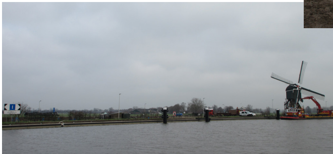
Renovatie aanlegplaatsen Merwedekanaal te Meerkerk, augustus 2022