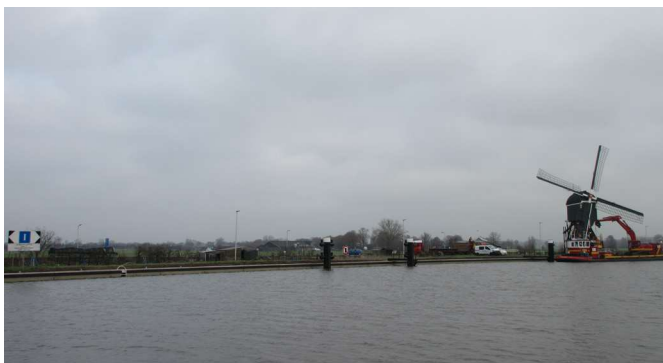
Meerkerk, oever, molen 21-12-2022

Voor meer informatie zie ook: Prov. Z-Holland