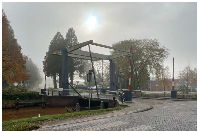
Een van de 34 bruggen in Pekela

Varen er in de toekomst nog bootjes door het Pekelderdiep? Het antwoord op die vraag leek een duidelijk "ja" te zijn, maar dat blijkt nu helemaal niet