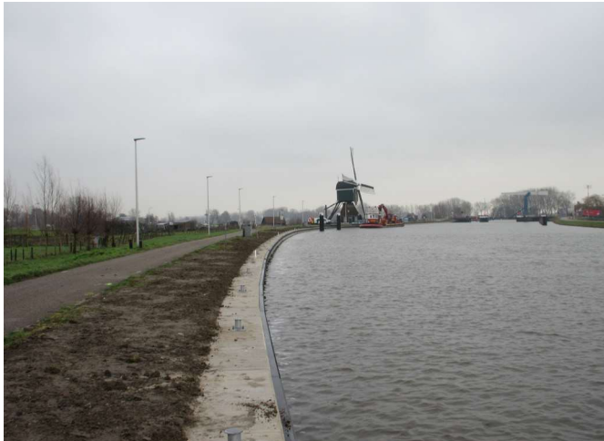
Meerkerk, nieuwe oever 21-12-2022

Hieronder vindt u een tekeningen van de nieuwe aanlegplaatsen alsmede foto's als impressie.